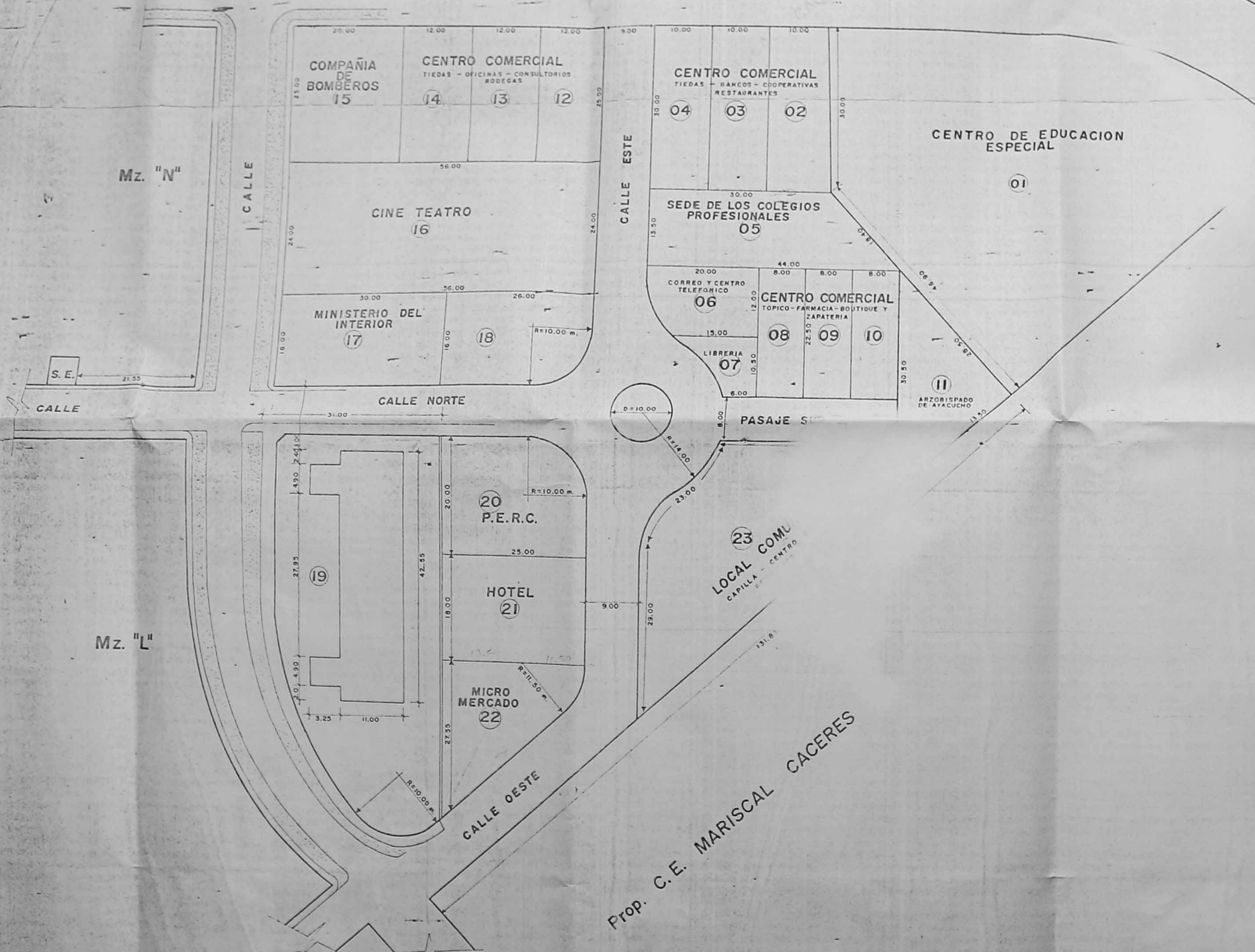
CUADRO DE DISTRIBUCION DE LOTES